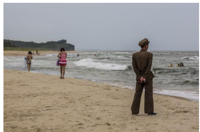
06_ Man in military uniform watches over beachgoers near Wonsan.