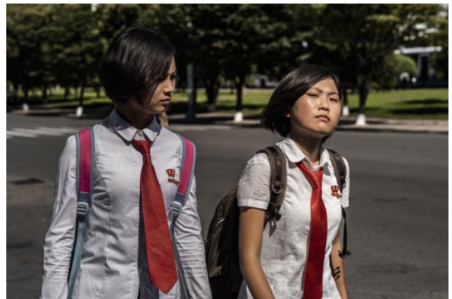
10_School girls. Pyongyang.