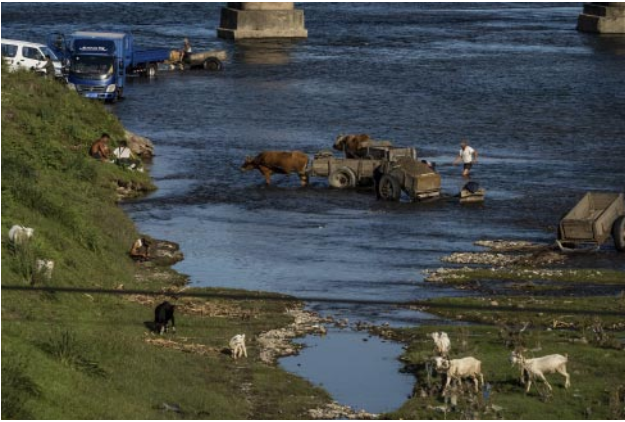
07_People wash cars and collect gravel at a riverbank on the road between Ulim Waterfalls and Hamhung in the country's east.