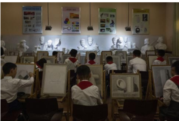
11_Drawing class at the Mangyongdae Schoolchildren's Palace in Pyongyang, the largest facility for children's after-school activities in North Korea.