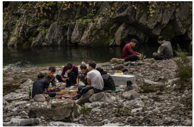
08_People have a picnic near the Ulim Waterfalls, named after the Korean word for echo, as its rumbling sound resonates across a four-kilometre radius.