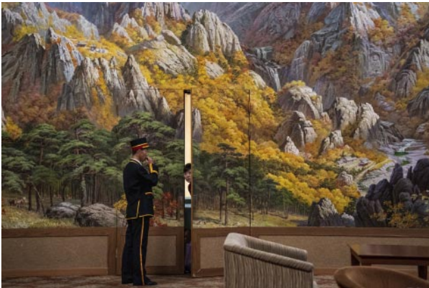
03_ A porter and a woman in the Kungangsan Hotel at Mt Kungang, This hotel is known for hosting reunion meetings between families from North and South Korea.