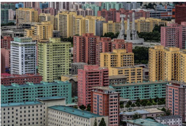
09_City view taken from the Tower of Juche Idea, Pyongyang. The Monument to Party Founding, top right of the image, portrays a worker, a farmer, and an intellectual holding hammer, sickle, and brush, respectively.