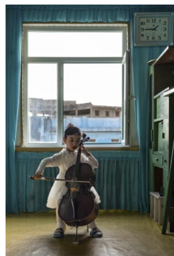
12_Girl plays a cello at Chongam Kindergarten, Chongjin.