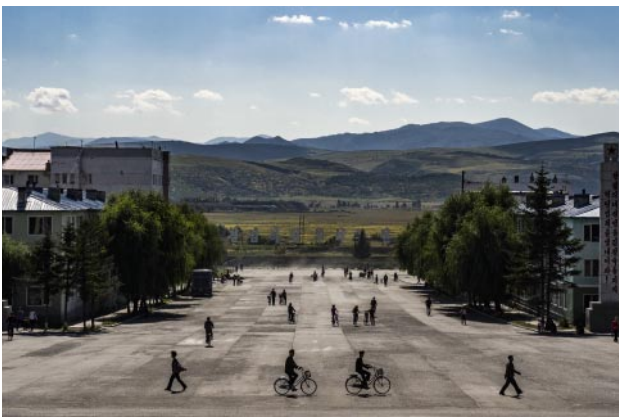
05_ Street scenes of Hoeryong as seen from the monument of Kim Jong Suk.