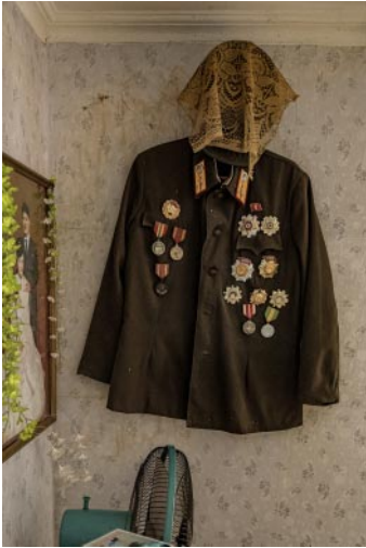
01_ A coat adorned with medals hangs in a home. Migok Cooperative Farm, Sariwon.